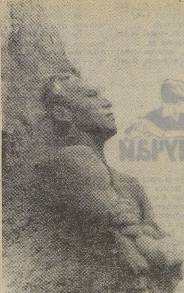
Памятник Герою Советского Союза Д. М. КАРЫШЕВУ, выполненный скульптором В. Е. Цигалем

...Перед железными воротами Маутхаузена возвышается монумент.