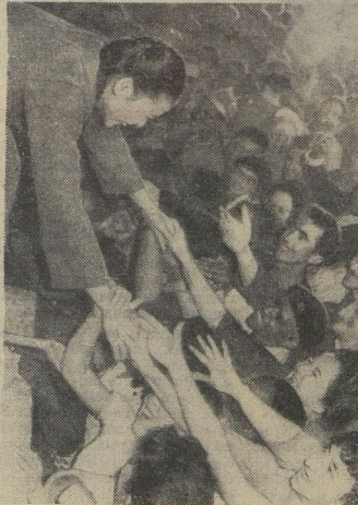
▲ Там встречают посланцев героического Вьетнама во всех странах мира.

◆ Ленинград, июнь 1970 года. Всемирная встреча молодежи, посвященная столетию со дня рождения В. И. Ленина.