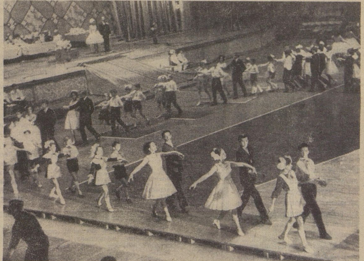
Тут даже самый-самый озорничка не придёт к голове держать одноклассника за банты. Все девочки становятся вдруг грациозными и лёгкими, точно бабочки, а мальчишки превращаются ну просто в настоящих галантных кавалеров. Всё так и бывает, если во Дворце пионеров конкурс балльных танцев. Этот снимок сделала киевская школьница Аня МОСКОВЧУК.