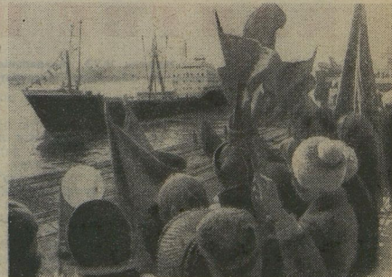
▲ Из бухты Золотой Рог школьники Владивостока помогают во Вьетнам «корабль образования».

А сколько сегодня наших учителей, врачей, инженеров работают в молодых развивающихся государствах! Для нас, воспитанных в духе пролетарского интернационализма и дружбы между народами, понятие «солидарность» никогда не было пустым словом. За ним всегда стояли дела. И сегодня во всём мире твёрдо знают: на советскую молодежь можно положиться. Всегда и во всём.