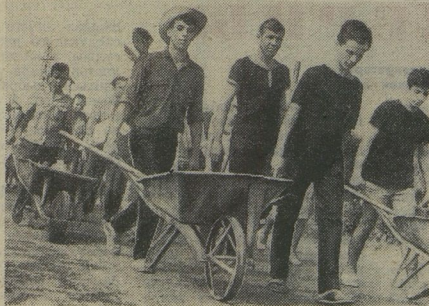
▲ Интернациональный студенческий отряд помогает своим алжирским друзьям построить в деревне Уадис новые школы, дома, дороги.