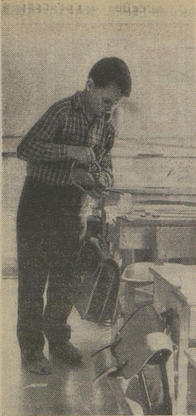
Не совсем уверенно чувствует себя человек, если ему первый раз приходится быть дежурным по классу. Начая ответственность!